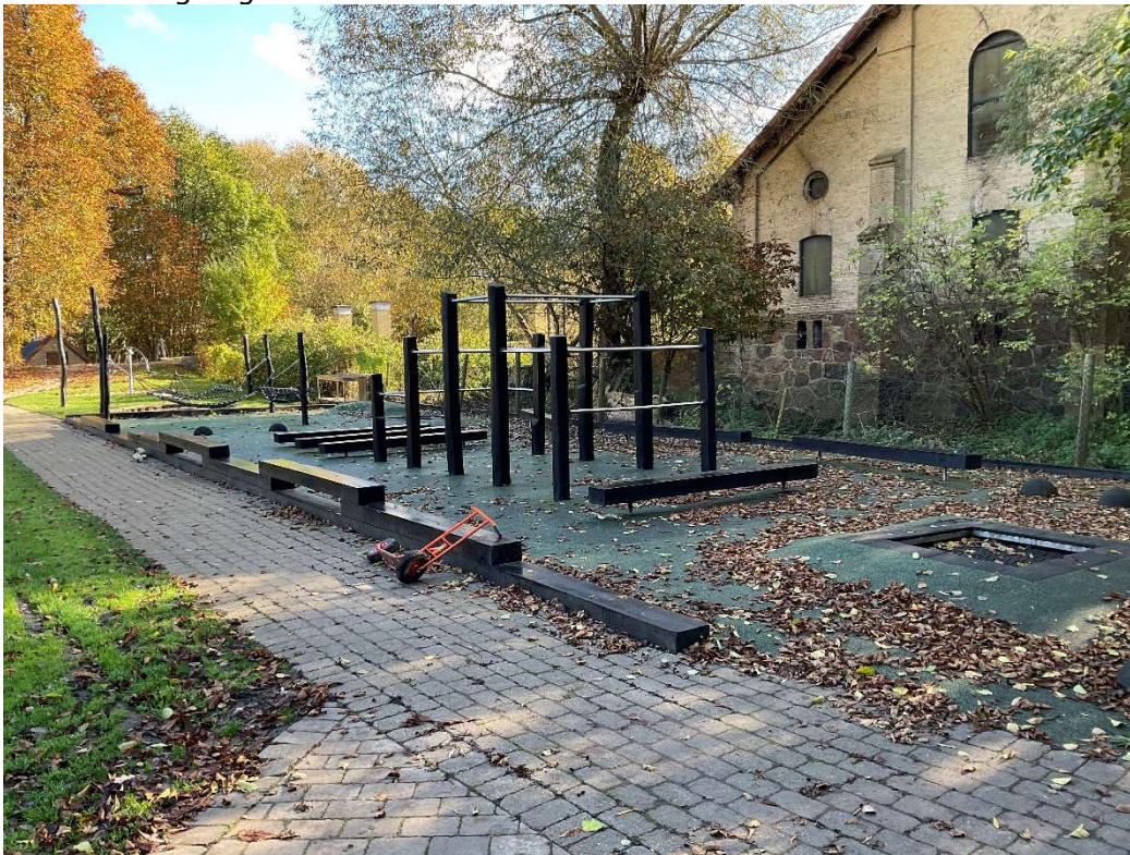
Kort 3: Billede af den ansøgte terrænbelægning.

Terrænbelægningen er beliggende inden for åbeskyttelseslinjen til Vedskølle Å ved Billesborgskolen. Terrænbelægningen måler ca. 225 m 2 . Etablering af terrænbelægning er et delelement i det samlede projekt opført i Billesborgsskolens udearealer. Formålet med terrænbelægning er at understøtte elevernes aktivitet og friluftslivet i området, herunder at der stadig er adgang til åen fra terrænbelægningen.