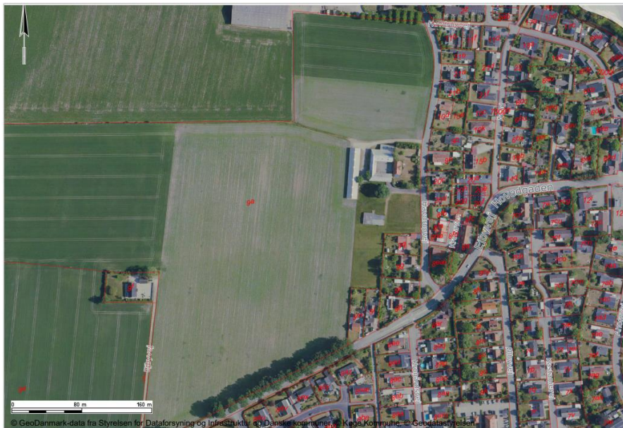
Kort 2: den pågældende matrikel