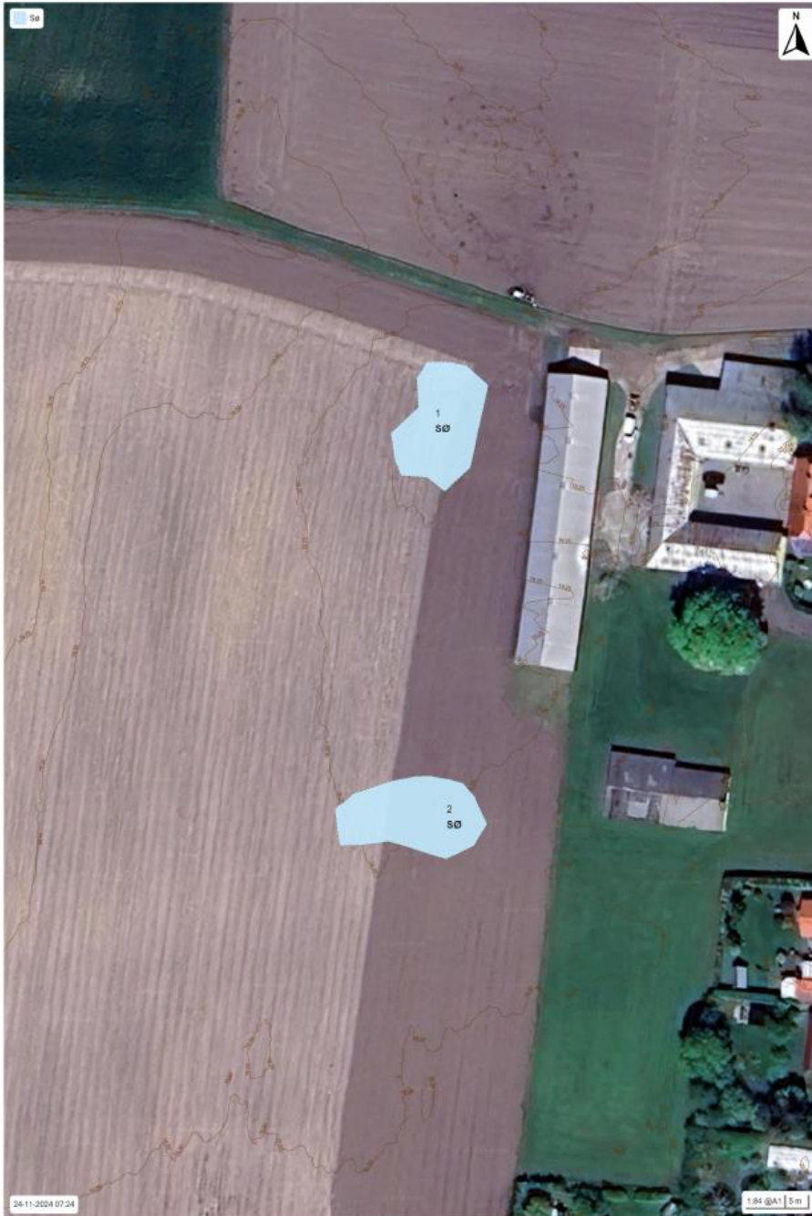
Skovkort - Lille Skensved, Køge Kommune