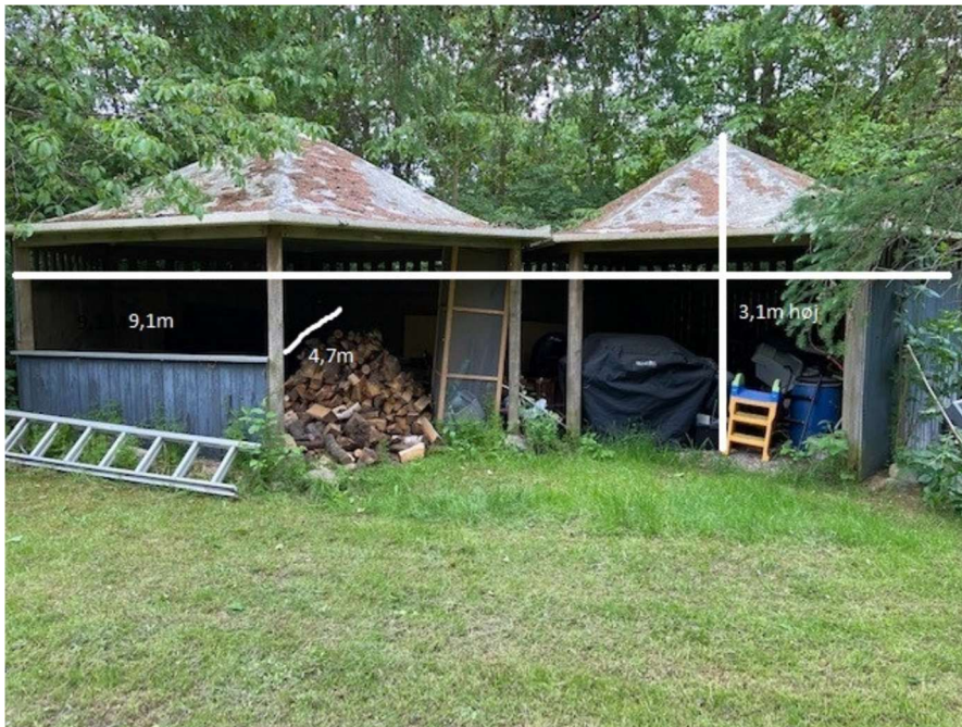
Billede 1: Billedet viser pavillonen og dens størrelse.

Shelteren er anlagt på en plads i haven, hvor det ligger ugeneret og gemt væk fra stien, der går langs søen. Den har udsigt mod huset og ikke direkte mod søen. Den er malet i en rødbrun farve. Shelteren ligger ca. 55 m fra huset.