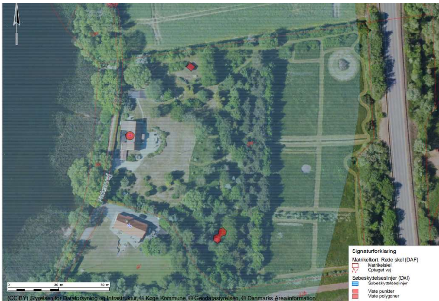
Kort 2: Oversigtskort over pavillon (rød figur nederst til højre) og shelter (rød firkant øverst til højre).

Pavillonen står mellem træer og buske midt på grunden og anvendes til opbevaring af bl.a. havemøbler og brænde. Pavillonen ligger ca. 65 meter fra huset.