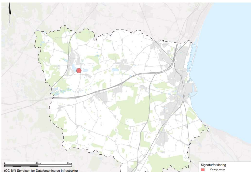
Kort 1: Oversigtskort med ejendommens placering i Køge Kommune (rød prik)

Køge Kommune har modtaget din ansøgning om lovliggørende landzonetilladelse og dispensation fra søbeskyttelseslinjen til opførelse af eksisterende pavillon og eksisterende shelter.