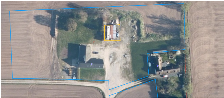
Hønsegårdens placering på grunden

Der gives hermed landzonetilladelse til opførelse af overdækket hønsegård på 100m 2