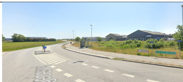
Egedesvej set fra øst. Lokalplanområdet ses til venstre i billedet.