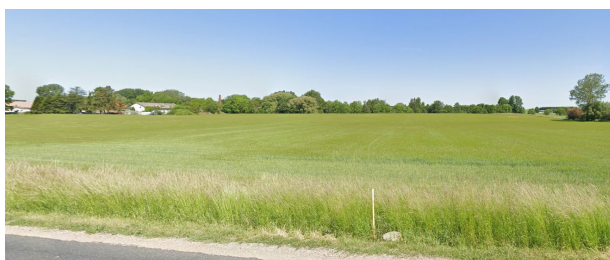
Lokalplanområdet set fra syd.