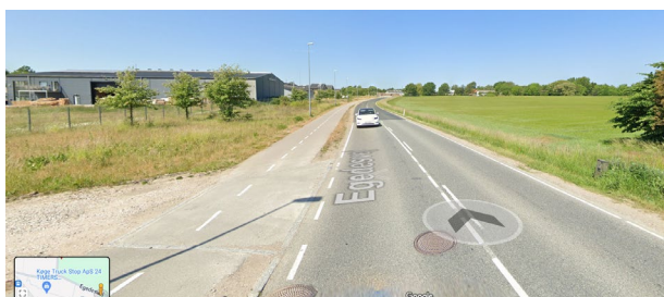
Egedesvej set mod vest. Lokalplanområdet ses til højre i billedet.