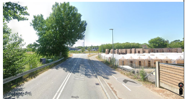
Naurbjergvej set fra nord. Lokalplanområdet ses til venstre i billedet.

Terrænet omkring Skensved Å stiger og falder mod syd således, at det former en øst-vestgående højderyg i den nordlige halvdel af lokalplanområdet. Lokalplanens byggefelt A er placeret syd for højderyggen, som dermed vil skærme dele af de 12,5 meter høje bygninger.