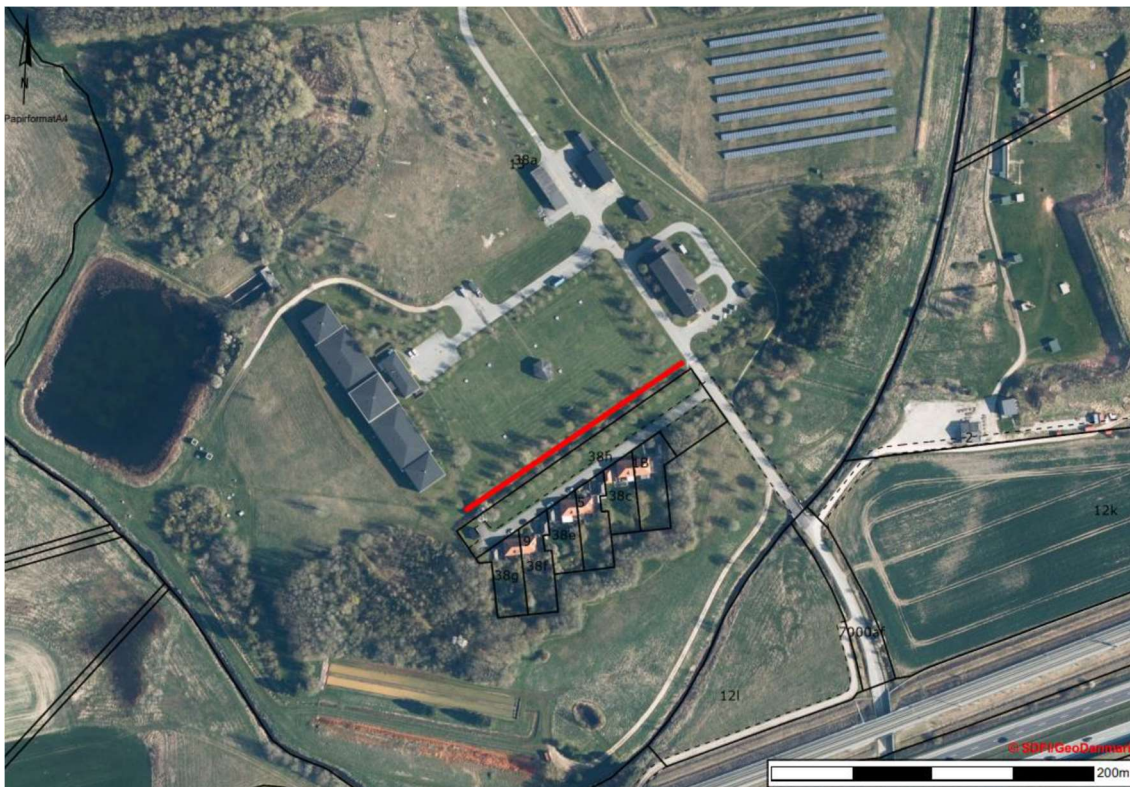
Kort 2: Omtrentlig angivelse af hvor støjvæggen (rød linje) placeres på matriklen.