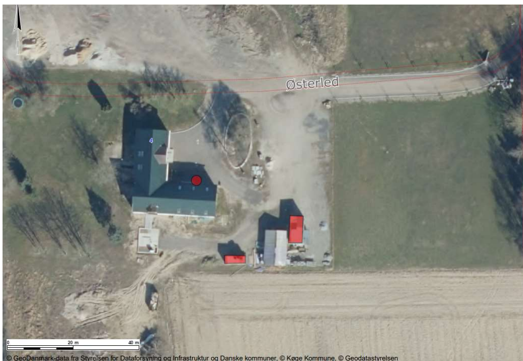
Kort 2: De midlertidige containeres placering (røde figurer) ift. huset. Samlet areal ca. 14,7 m 2 med målene 2,45 m (bredde) og 6 m (længde) og 29,6 m 2 med målene 3,7 m (bredde) og 8 m (længde).