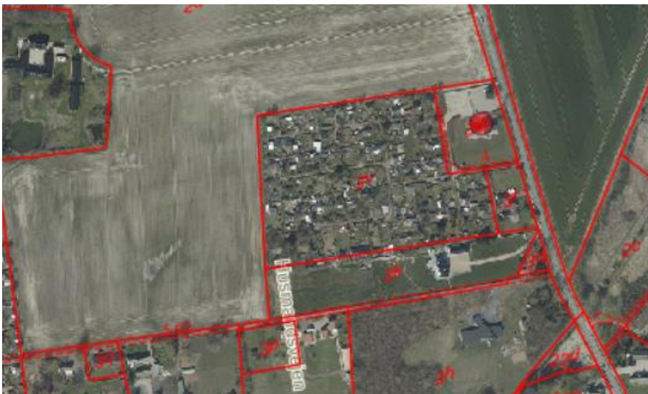
Beliggenhed for ejendommen Egøjevej 116